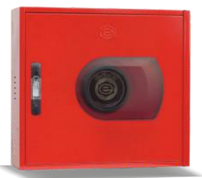
Mod. VERSAL R