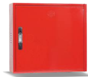
Mod. VERSAL C