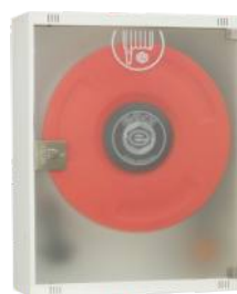
Mod. 690 PEI-R Mod. 690 PEI-RT45