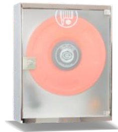
Mod. 690 PEI Mod. 690 PEIT45