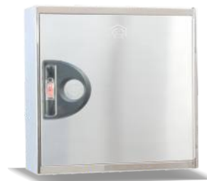
Mod. L20 IN