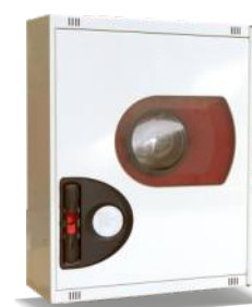
Mod. 690 R Mod. 690 RT45