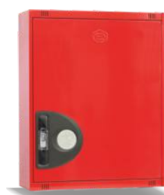
Mod. 690 C Mod. 690 CT45