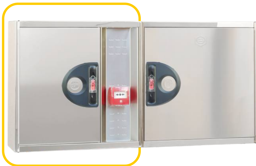
Ref. MTL20IN Configuración Horizontal