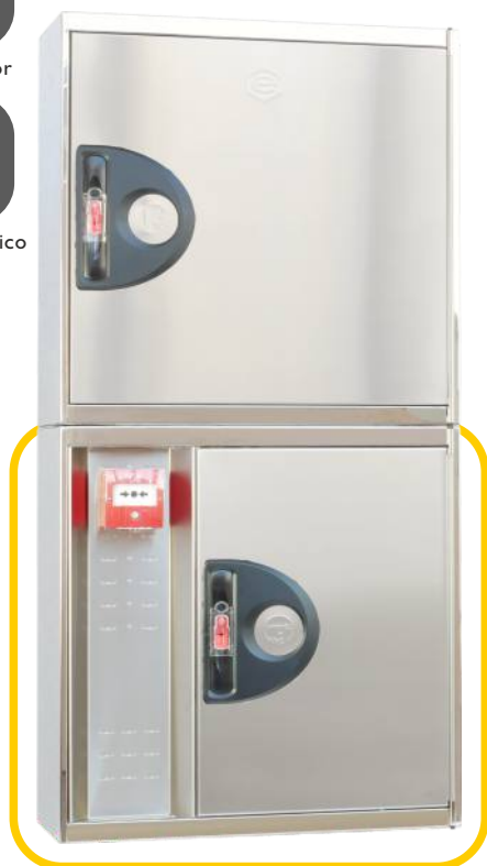
Ref. MTL20IN Configuración Vertical