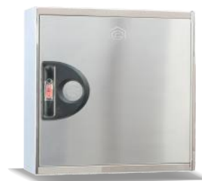
Mod. L20 IN