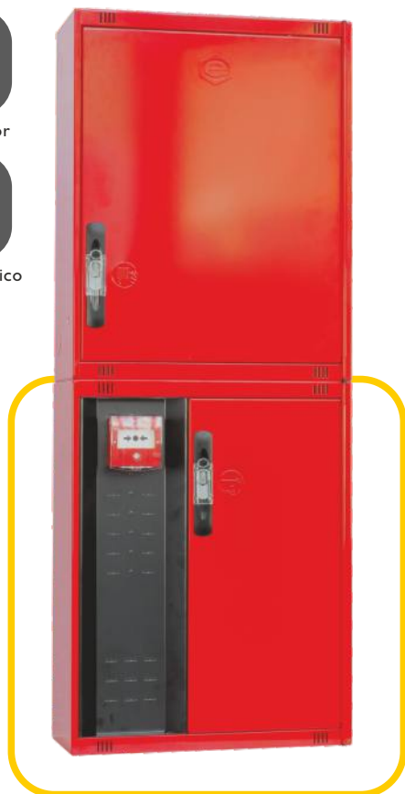
Ref. MT530C Configuración Vertical