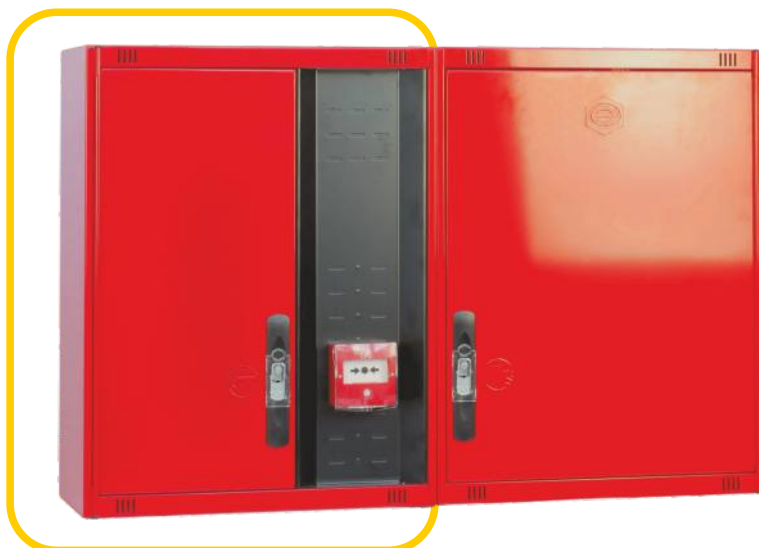
Ref. MT530C Configuración Horizontal