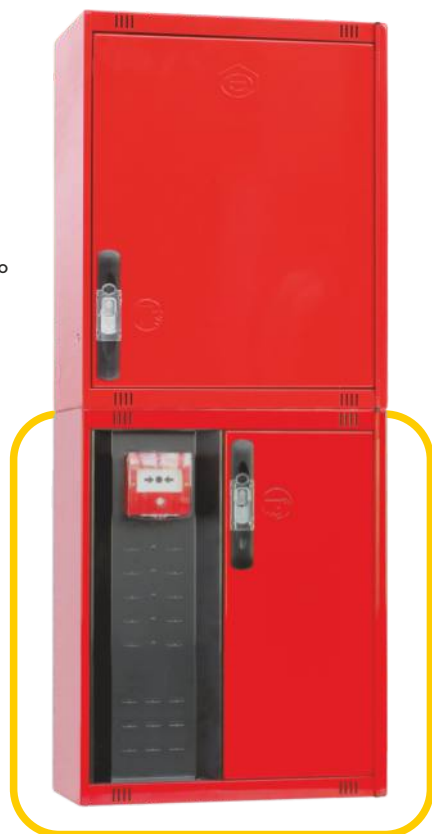
Ref. MT470C Configuración Vertical