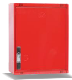
Mod. 470 C