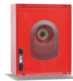
Mod. 470 R