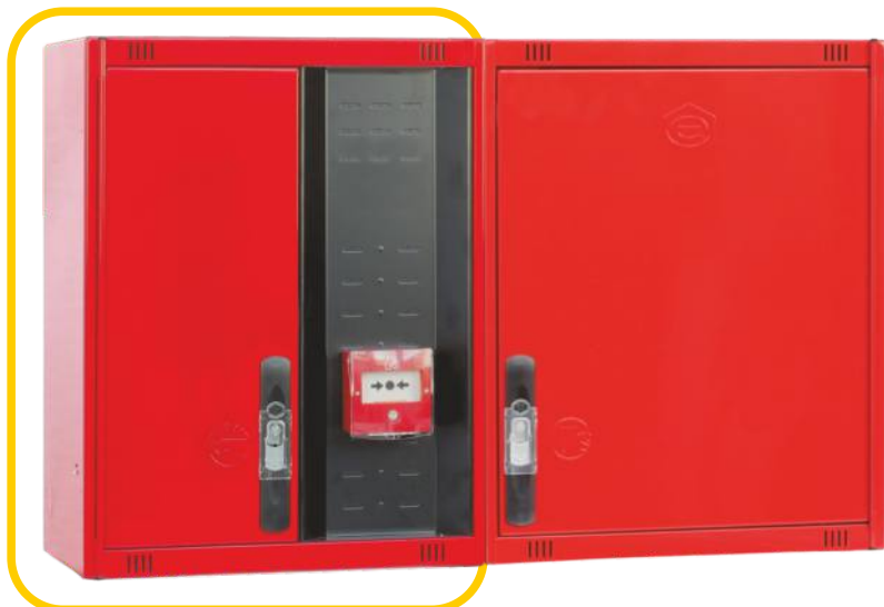
Ref. MT470C Configuración Horizontal