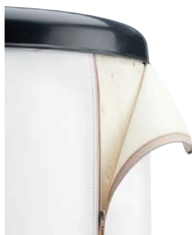
BLANCO: RAL 9016