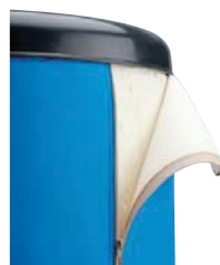
AZUL: RAL 5015