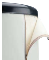
GRIS: RAL 7045