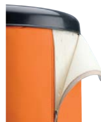
NARANJA: RAL 2004