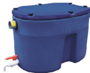
SEPARADOR DE GRASAS BAJO FREGADERO

Equipados con bocas hombre de Ø400 o Ø600 para facilitar su instalación y mantenimiento.