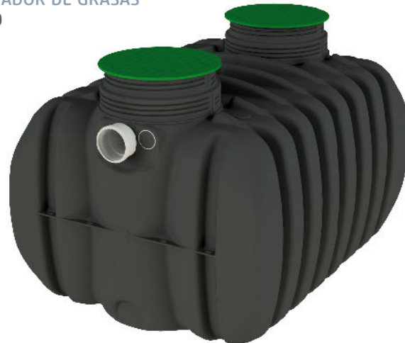
SEPARADOR DE GRASAS 185 5000