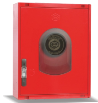
Mod. 530 R Mod. 530 RT45