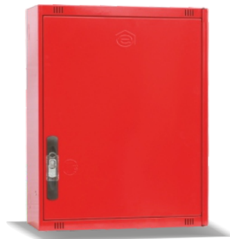
Mod. 530 C Mod. 530 CT45